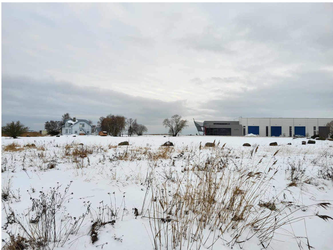
Joonis 3. Vaade planeeringualale suunaga kirdest edelasse