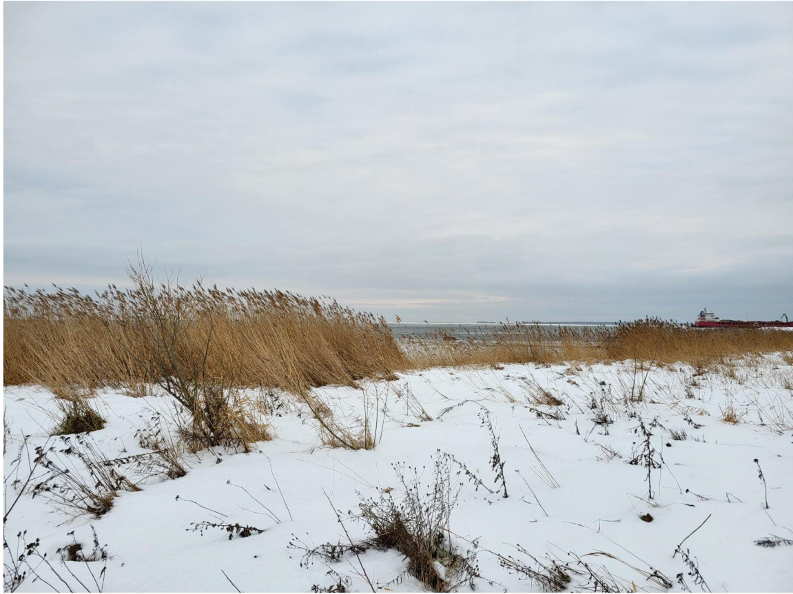
Joonis 2. Kinnistult juurdepääs kallasrajale, vaade läänest itta